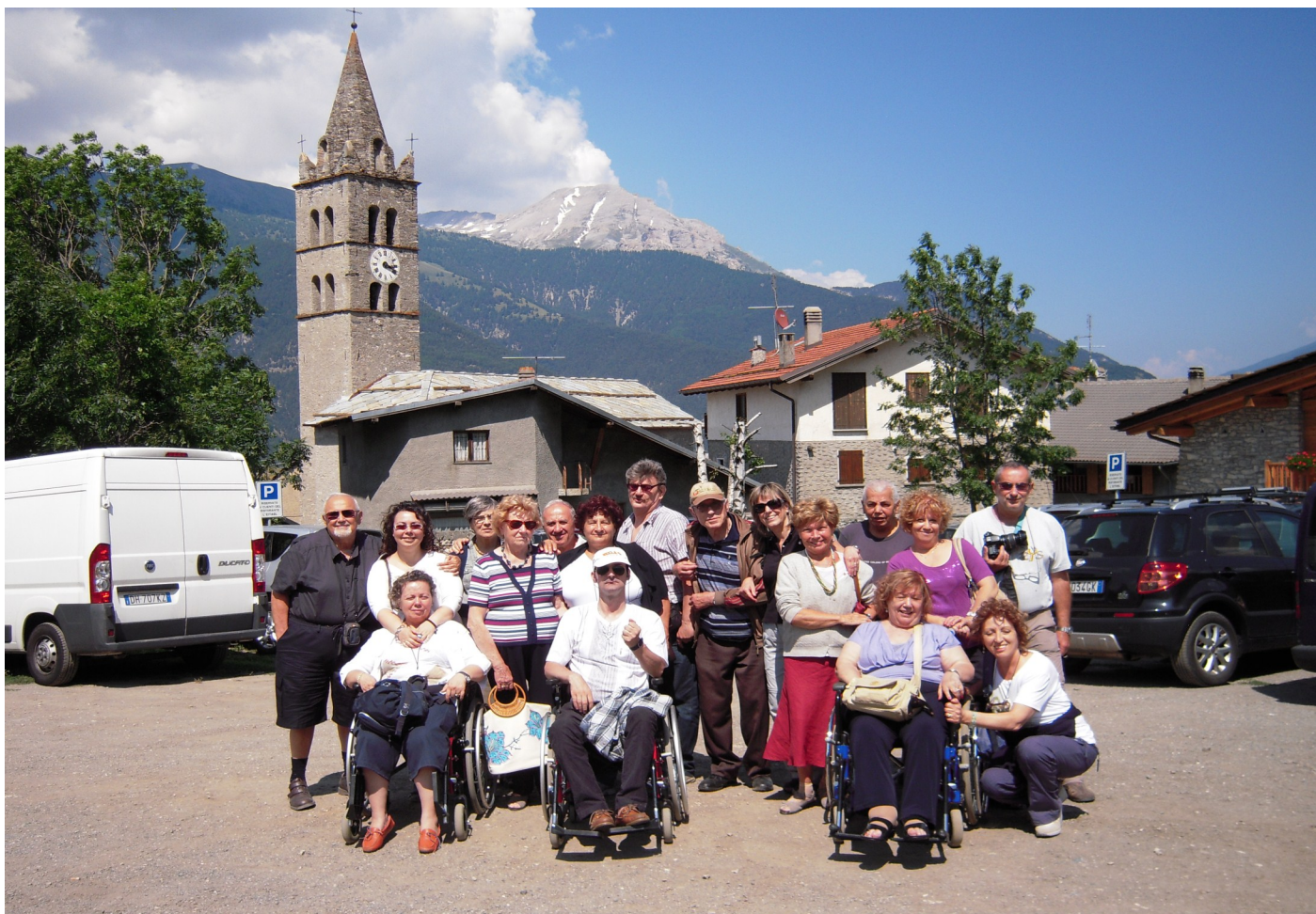
FOTO RICORDO DI UNA GIORNATA TRASCORSA INSIEME AI NOSTRI AMICI DISABILI A CHATEAU BEAULARD. ( 21 LUGLIO 2013)